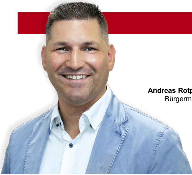
Andreas Rotpüller Bürgermeister

D ie Pandemie hat uns noch immer voll im Griff, wir kommen in Österreich nicht aus der Spirale der ungeschlossenen Covid-Regelungen der Bundesregierung heraus, was dazu führt, dass das Vertrauen der Bevölkerung immer mehr verloren geht.